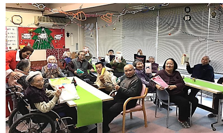
「クリスマス会」のひとつコマ。「これ、ホントに貰っちゃってもいいの?！」と、皆さんクリスマスプレゼントを手に大喜び!