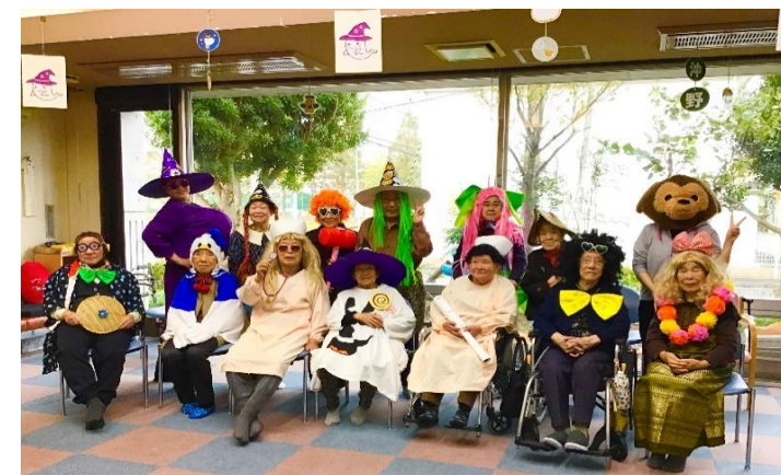
「仮装大会」のひとつコマ。皆さん大変身!「この衣装どう?あら、そっちゃんもカワイいわねえ!」心も表情もノリノリの日でした。