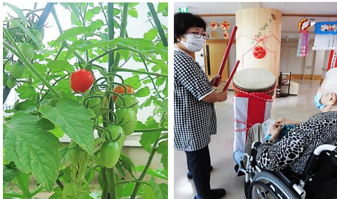
[写真左] 陽当りのいいテラスで実ったプチトマト。 [写真右] 夏祭りといったら、太鼓に合わせて盆踊り。

創快館は、令和2年7月に「ケアハウス」から「住宅型有料老人ホーム」に事業転換し、間もなく3年目を迎えます。各種居宅介護サービスもご利用いただけるようになりました。