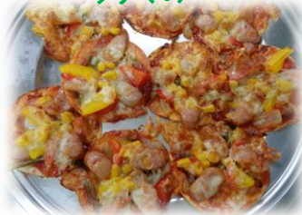
演目：くれよんのくろくん 餃子の皮の花火ピザ