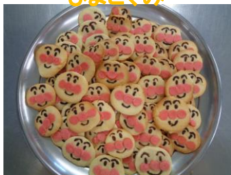
演目：ふうせんのうた アンパンマンクッキー