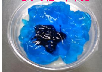
演目：金の斧と銀の斧 泉のゼリー