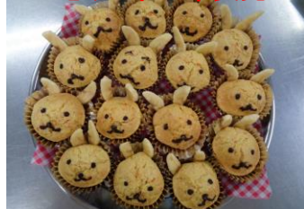
演目：どうぞのいす うさぎのにんじんケーキ