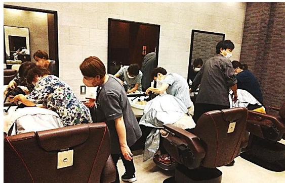
※写真左 椅子に座った状態で洗髪する「スタンドシャンプー」技術を学びました