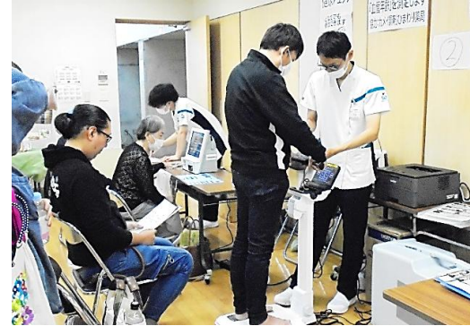
※写真左 北山市民センターで開催された「北山交流まつり」に出展しました