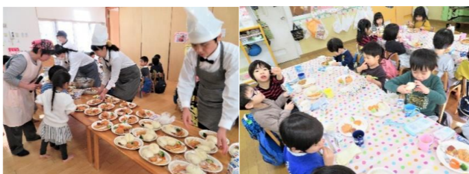
「ピストロ柏木」(笑)のシェフが腕を振ったスペシャルランチに子ども達も嬉しそう。美味しい笑顔があふれた一日でした。

■柏木保育園 仙台市青葉区柏木1-5-3 ☎022-275-2525 ☎(fax) 022-275-2515 ※柏木保育園の詳細は