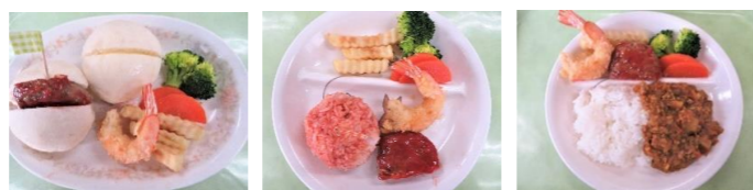
〇ックより美味しい? 【ハンバーガーランチ】

いつもとちょっと違う給食の時間は、子ども達にとって最高のひとときとなったようです。