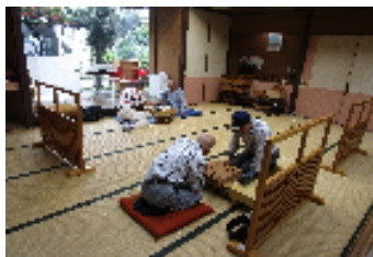
大広間(囲碁・将棋)