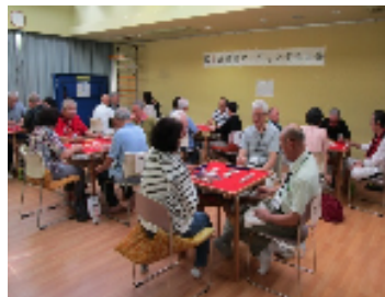
健康マージャン交流大会