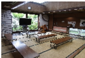
大広間(休憩スペース)