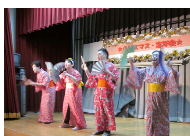
男性介護士による「鳩ポッポー」