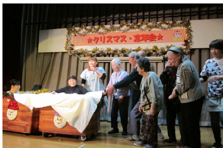
マジックのタネがばれても なんのその 女性介護士