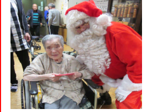
サンタクロース来園