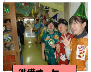
準備オーケー 出番待ち