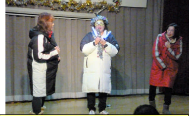
不思議な怪しい集団による 不思議な劇 女性介護士