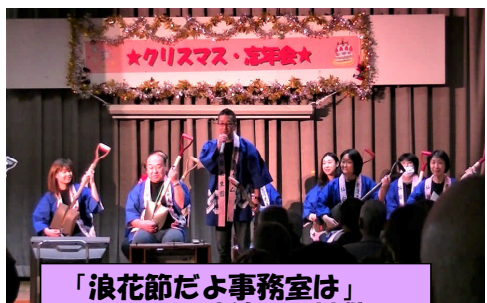
「浪花節だよ事務室は」 スコップ三味線への挑戦