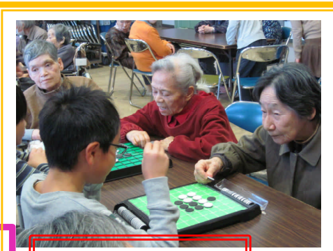
荒巻小学校交流会